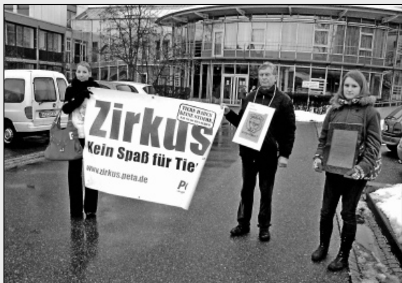
Tierschützer empfingen Volker Kauder mit einer Mahnwache vor dem Rottweiler Landratsamt