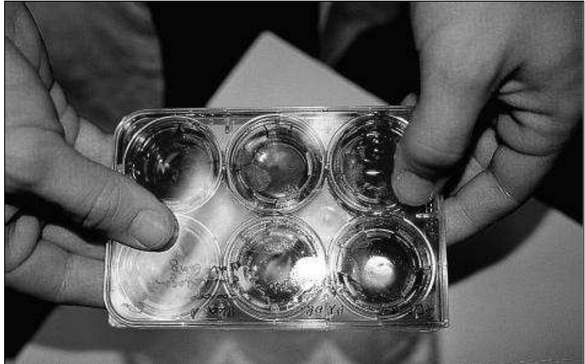
Künstliche Haut in Nährlösung

Die Aufnahme der neuen, tierversuchsfreien Methode in die OECD -Vorschriften wurde durch die Expertise von ICAPO erreicht. Das ist ein Zusammenschluss von Vereinigungen von Tierversuchsgegnern aus Nordamerika, Europa und Japan, der einen Sitz bei der OECD hat.