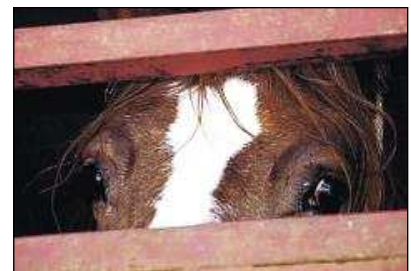
Die weit aufgerissenen Augen spiegeln die Angst wider

Diese schrecklichen Zustände herrschen nicht nur in Skaryszew, sondern in auch vielen weiteren polnischen Viehmärkten, wo Schweine, Rinder, Schafe, Pferde und weitere Tiere gehandelt werden.