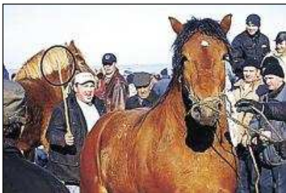
Der dicke Stock, mit dem das verschüchterte Pferd durch die Menschenmenge getrieben wurde, ist durch die Schläge abgebrochen

Über 1.500 Pferde wurden geschlagen, getreten und durch Menschenmassen von Schaulustigen getrieben! „Niemand ging mit dem 'wertlosen Schlachtvieh' zimperlich um. Es war furchtbar, so viel Tierquälerei mit ansehen zu müssen,“ so die Beobachter der Tier-WeGe .