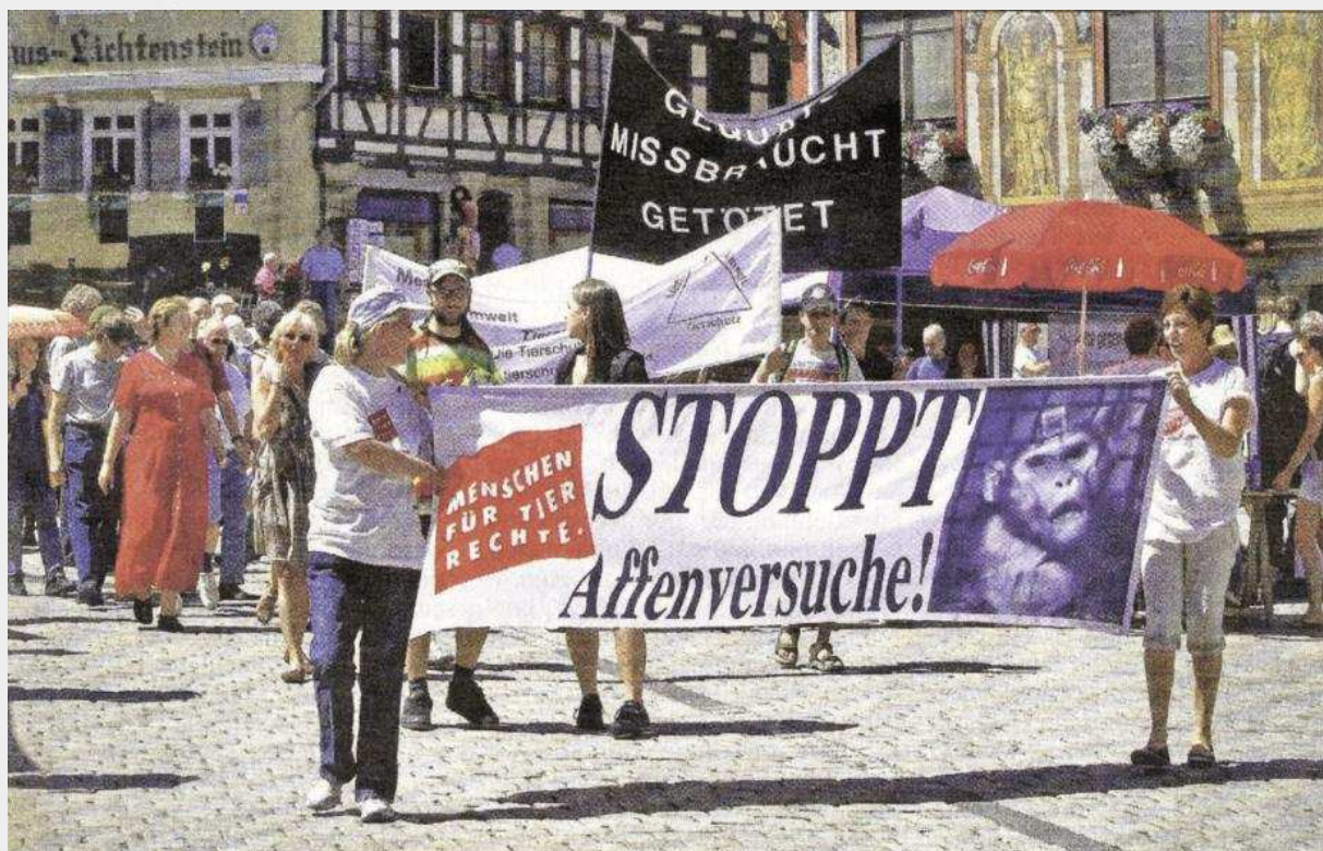
Mit Bannern und Parolen zogen Tierversuchs-Gegner am Samstag vom Tübinger Marktplatz ins Univiertel.