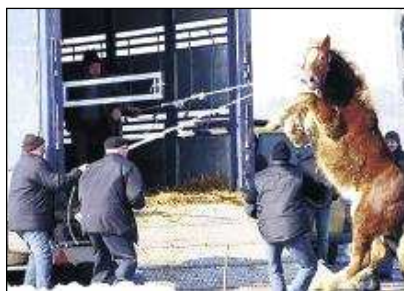
Die Aufladeprozedur dieses Pferdes, das sich mit aller Kraft wehrte, dauerte eine halbe Stunde .

Mit dem unbeschreiblich brutalen Aufladen, dem Prügeln der Tiere auf die Transporter, traten sie nun den Weg über tausende Kilometer an - ohne Tränkesystem!