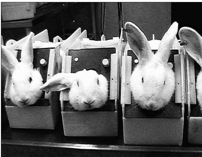
Stundenlange Fixierung in Messapparaturen

Im Juli dieses Jahres wurde auf internationaler Ebene ein menschliches Hautmodell offiziell anerkannt, mit dem Substanzen auf ihre Haut schädigende Wirkung untersucht werden. Das Hautmodell, das unter Namen wie EpiDerm oder EpiSkin seit Jahren im Handel ist, verwendet menschliche Haut, um zu prüfen, ob Chemikalien oder Kosmetika hautreizend sind.