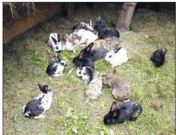
Bodenhaltung bei einem Biobauern