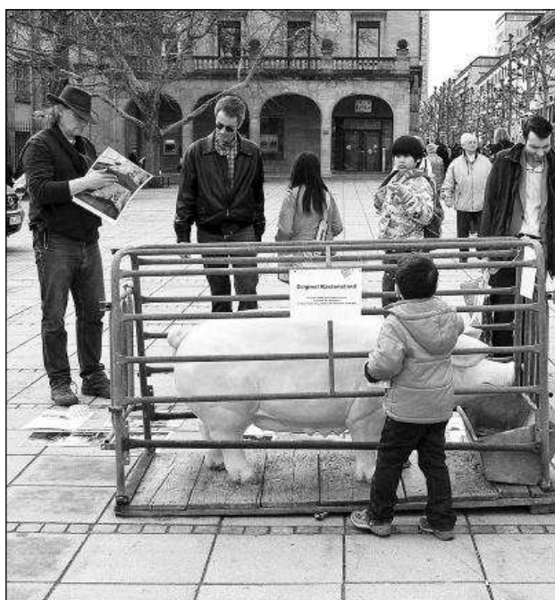
Original Kastenstand für Schweine