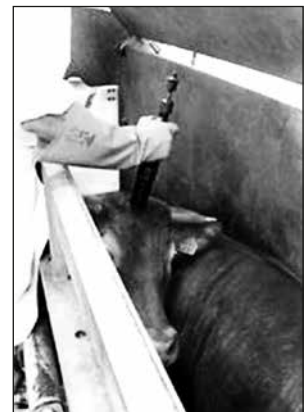
Die letzten Augenblicke im Schlachthof